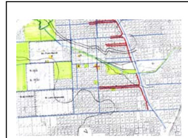
Figura N°3 - Los asentamientos que se localizan en esta zona son: el María Elena, el 24 de febrero, el 17 de octubre, el Latinoamérica, El Porvenir y El Vivero. El 24 de febrero y el 17 de octubre están sobre terrenos de propiedad de la CMV; los demás en tierras privadas.