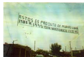
Foto N°3. 17-10-1995. Festejando la entrega de boletos de propiedad.