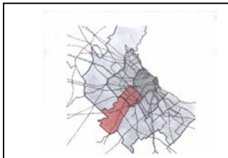
Figura N° 1- Crecimiento en cordones del Area Metropolitana. En rojo se señala el Partido de La Matanza. Las zonas grises indican (de oscuro a claro) la ciudad de Buenos Aires, el 1er cordón del Area Metropolitana, y el 2do cordón. Se observa que el Partido de La Matanza se encuentra en ambos cordones