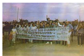
Foto N°2. Movilización en reclamo por la propiedad de los lotes. 1987