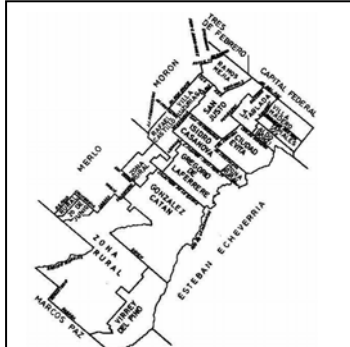
Figura N°2 - Localidades del Partido de La Matanza