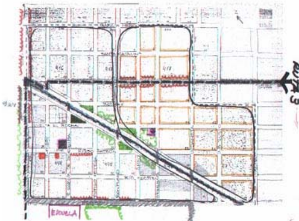
Figura N°4 Planimetría esquemática actual del Barrio María Elena. En diagonal el Arroyo Dupuy que atraviesa el barrio.